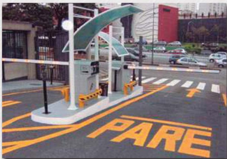
Lectores UHF posicionados para la identificación en las pistas