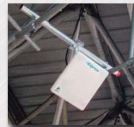
Antenas para la lectura de tags