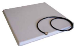
Antena L-AN300 / L-AN350