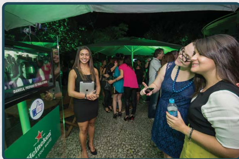
Portabilidade, Facilidade e Sutileza Visual