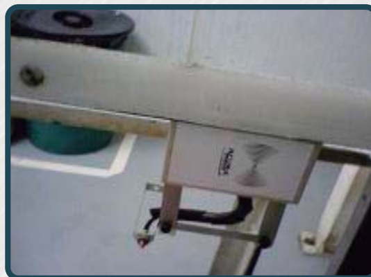
Produtividade com solução RF Tags